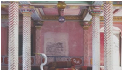
VIII PREMIO DE FOTOGRAFÍA CONTEMPORÁNEA PILAR CITOLER